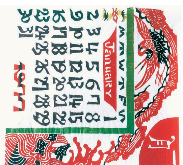
Kalendertafel im Schablonendruck ( Katazome ) aus dem Jahr 1977 von Keisuke SERIZAWA (1895 - 1984) „Lebender nationaler Kulturschatz“ ( Ningen Kokuhō )

Die hohe Qualität des meist aus Pflanzenfaserbrei handgeschöpften Papiers "Washi" führte in Japan zu einer breiten Palette von Verwendungsmöglichkeiten dieses Materials. Durch seine Lichtdurchlässigkeit, Reißfestigkeit und seine teils kunstvollen Strukturen wurde es Glas- und Seidenersatz. Die Dehnbarkeit erlaubte Rundformen zu bespannen. Die Saugfähigkeit unterstützte die Kunst der Tuschmalerei und Kalligraphie. Geleimt, geölt, gewachst, lackiert, gedreht, zerissen, verwebt, geformt oder wasserundurchlässig gemacht, wurde Washi ein wertvolles Material für das gesamte Handwerk. Die geschmeidige Qualität erlaubte die Entwicklung der Formenvielfalt in der Papierfaltkunst Origami . Bis heute lernen Japaner von Kindesalter an das Falten von Glückssymbolen. Ketten aus 1000 gefalteten Papierkranichen werden angefertigt, um Stühne zu leisten oder Genesungswünsche auszudrücken. Kunstvolle Papierdekorationen schmücken zu Festen das Heim und sakrale Stätten, und mit Japanpapier überzogene Körbe und Schalen gehören im weitesten Sinne zu der in Japan hochentwickelten Kunst der Verpackung.