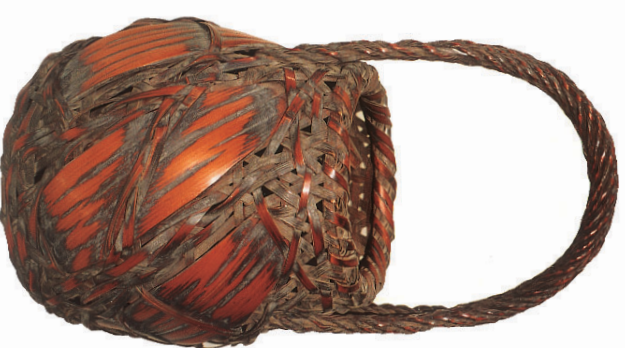
Traditioneller Blumenkorb für Ikebana , die Kunst des Blumensteckens

In Japan wächst fast überall Bambus "Take" . Es gibt zahlreiche Arten, die als Gras oder Strauchwerk den Boden bedecken oder in lichten Bambushainen und dichten Wäldern viele Meter hoch in den Himmel wachsen. Die Biegsamkeit des Rohres in Sturm, Regen und Schnee und seine Standfestigkeit bei Erdbeben ließ ihn in Japan zum Symbol für ungebrochenen Lebenswillen werden. Alle Teile der Pflanzen können durch die einmalige Materialbeschaffenheit vielseitig verwendet werden, sowohl die Bambussprossen als Delikatesse in der japanischen Küche als auch die Bambusblätter und -rohre. Ob zur Herstellung von Haushaltsutensilien, Gartengeräten, Werkzeugen, Musikinstrumenten, Kampfsportwaffen, oder beim traditionellen Hausbau für die Außen- und Innengestaltung – Bambus bleibt bis heute unentbehrlich. Kunstvoll gearbeitete Bambusgeräte werden seit dem 16. Jh. bei der Tezeremonie benutzt. Als beliebtes Motiv findet man die Pflanze auf Wandschirmen, Bildrollen und Geweben, in Gesängen, Mythen und Legenden, als Bezeichnung in Orts- und Familiennamen und in über 100 Schriftzeichen ( Kanji ) als Komponente wieder.